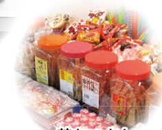
昔なつかし駄菓子コーナー