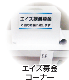
エイズ募金コーナー