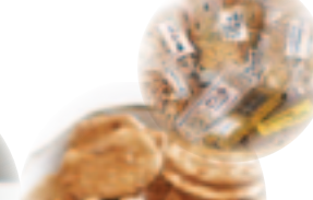
東北産お菓子コーナー