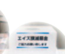
エイズ募金コーナー