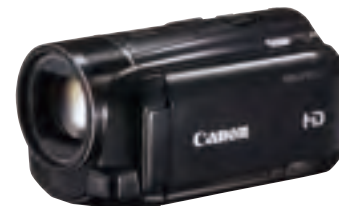
300-1 ●キヤノンデジタルビデオカメラ

出品メーカーお買い上げ代金小売価格5,000円に対し、サービス補助券を1枚差し上げます。補助券10枚とサービス1口券を交換の上、下記一覧の商品からお選び下さい。