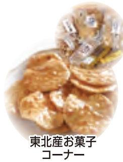
東北産お菓子コーナー