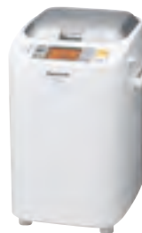
100-2 ●パナソニックホームベーカリー