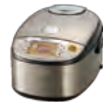
100-4 ●象印圧力IH炊飯ジャー