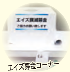
エイズ募金コーナー

社会貢献の一環として献血コーナー、エイズ募金コーナーを実施しております。みなさまの温かいご協力よろしくお願いたします。 また東北復興支援活動として【食べて応援しよう!】で東北産のお菓子をご用意いたしております。