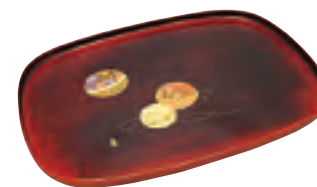
15-E ●福島 会津塗小判盆