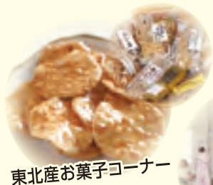
東北産お菓子コーナー