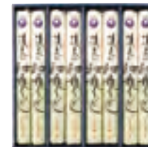
15-A ●秋田 稲庭うどん